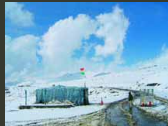
Roadblock nummer zoveel.