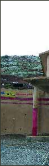
Ons hotel. All incl