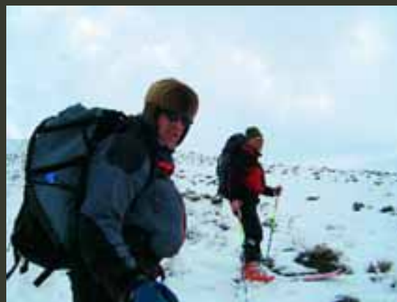
Vergeer en Naar oefenen.

We eten brood met soep, brood met tahin, brood met brood. Met resten schrapen we blikjes vis schoon. Een oude haaperende benzinekachel probeert de kou wat buiten te houden, met 7° C als hoogst haalbare resultaat. We plassen