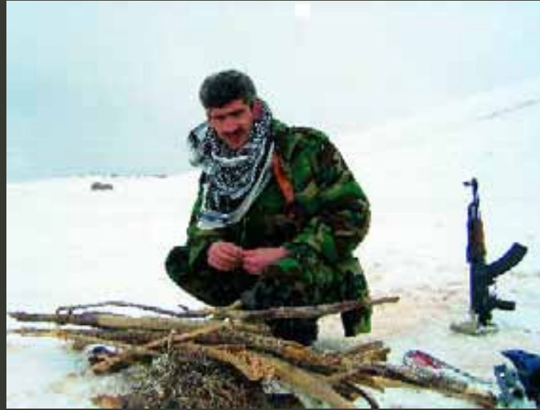
Onze mijnexpert maakt vuur voor een potje thee.