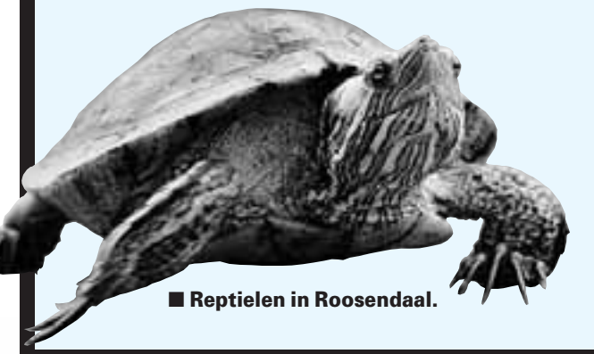
■ Reptielen in Roosendaal.

NOORDWIJK Weddingfair in het Palace Hotel (Pickleplein 8). Alles over trouwen, vrijgezellenfeesten, videoreportage, nagelverzorging, huwelijksreizen en bruidskleding, getoond tijdens drie modeshows, 11.00-18.00 uur. Entree € 10. AARLE-RIXTEL Harley-Davidson Motor Beurs in en rond De Dreef (Bosscheweg). Vele motoren te zien en te koop, evenals onderdelen, kleding en accessoires. Tevens jukeboxes, piercings en tattoos, 10.00-17.00 uur. Entree € 7, kinderen tot 12 jaar gratis.