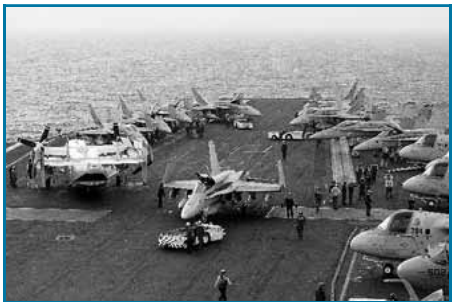
■ Het leven van de piloten is beslist geen 'Top Gun'.

Thuishaven: Norfolk (Vst) Lengte: 334 m Max. snelheid: 55,6 km/u Meters bekabeling: 1.448 km Aantal bemanningsleden: 5.200 Aantal maaltijden: 18.150 p.d. Watergebruik: 1.500.142 l/p.d. Aantal lampen: 30.000 Linnen: 14.000 kussenslopen en 28.000 lakens Toilet papier: 140.000 rollen Telefoon: 2.000