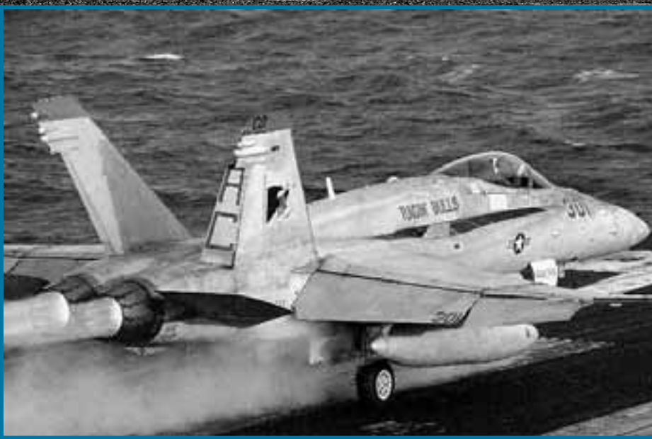
■ Zowel de start als de landing is spectaculair op een vliegdekschip. Vanwege de beperkte ruimte wordt er met een katapult afgeschoten, respectievelijk met een stalen kabel tot stilstand gebracht.

Het piepkleine oliekoninkrijk Bahrein blijkt de uitvalsbasis. Hier hebben de Amerikanen een Britse haven